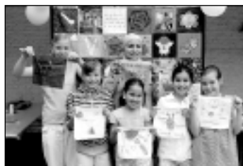
War Child dag

Rond het jaar 2012 zal het Vredes Groeitapijt verkocht worden en de opbrengst zal ten goede komen van War Child. Zij zullen een aantal stukken van het Vredes Groeitapijt meenemen naar gebieden waar ze met kinderen werken die kindersoldaten waren.